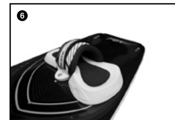
6 Place the second velcro strap on top the first one. Placer la seconde sangle velcro sur la première.