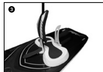
3 Insert the strap lock in the strap and pass the velcro in the appropriate hole. Enfiler le strap lock dans le strap en passant la sangle velcro dans le passage prévu.