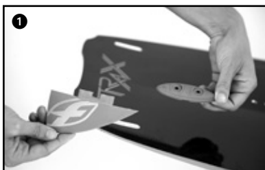
1 Have correspond the green fins to the green holes of the board. Repeat the step for red fins.

Pour respecter le sens du profil asymétrique, les ailerons ont un code couleur au talon (rouge et vert). Cette couleur se retrouve dans la partie femelle des planches. En outre, les parties « box » supérieures n'ont pas de sens ou de positions précises.