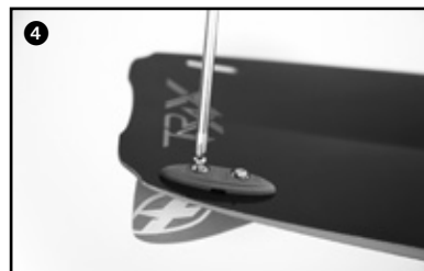
4 Screw on the fins. Visser les ailerons.