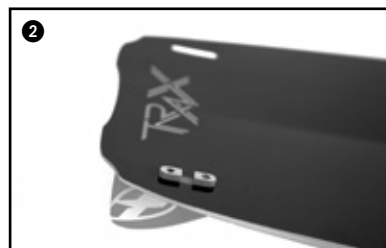
2 Place the fin into the hole of the board. Placer l'aileron dans le trou de la planche.

Faire correspondre les ailerons verts aux trous verts de la planche. Idem pour les rouges.