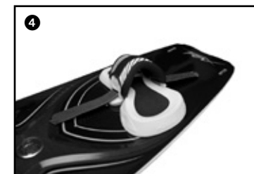
4 Set up the height of the strap for your size by gliding the strap over the strap lock. Régler la hauteur du strap en fonction de votre pointure en faisant glisser le strap sur les straps lock.