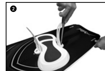
2 Screw in the strap lock. Serrer les vis.